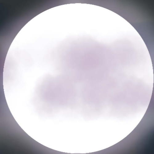
ECLIPSE SOLAR A TRAVÉS DE LA CÁMARA

¡POR FIN LA TECNOLOGÍA DA BUENOS RESULTADOS!